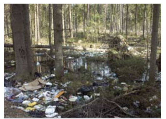
Оставление мусора на лесосеке или разливы горючесмазочных материалов — важное и широко распространенное нарушение.

Во многих регионах широко распространена практика вываливания бытового и промышленного мусора в лесах, слива отработанного масла — просто для того, чтобы не платить за утилизацию отходов. Особенно часто мусор вываливается именно на участках свежих вырубок: во-первых, туда обычно ведут более или менее проезжие тупиковые дороги, которые позволяют злоумышленникам заехать в лес и вывалить мусор втайне от чужих глаз; и, во-вторых, важен психологический момент — безобразно проведенная рубка часто сама по себе выглядит как помойка, или сильно обезображенная