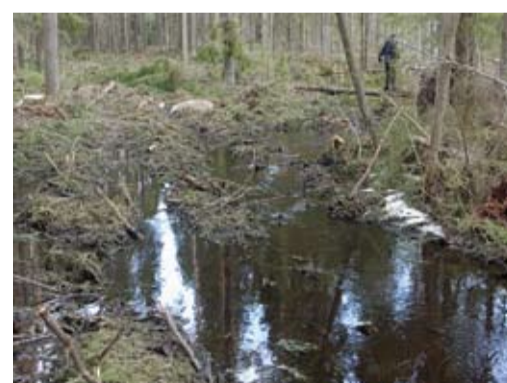
Довольно распространенным нарушением является трелевка древесины прямо по руслам ручьев.

Сложнее обстоит дело с рубками главного пользования в водоохраных зонах. Современная система лесных правил позволяет проводить в водоохраных зонах рубки ухода или санитарные рубки, по своим параметрам полностью аналогичные рубкам главного пользования (например, сплошные