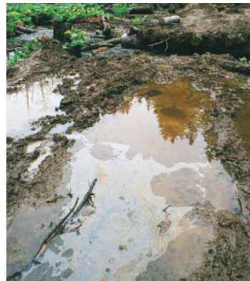
Обычным нарушением является хранение ГСМ в водоохраных зонах, в результате чего масла и топливо попадают в воду.

Тем не менее, часто случается, что при проведении рубок поблизости от водоемов лесозаготовители организуют стоянки своей техники и склады горюче-смазочных материалов, ремонт и заправку техники в водоохраных зонах. Это может приводить, особенно если используется устаревшая и лишь условно исправная лесозаготовительная техника, к разливам топлива и масла, и в конце концов к загрязнению водоемов. Размещение техники в водоохраной зоне — это нарушение, следы которого впоследствии легко скрыть, поэтому на него следует обращать внимание в первую очередь как на некое «дополнительное» нарушение — когда имеются иные,ставляющие более долгоживущие материальные следы. Исключение могут составлять случаи, когда техникой разбиваются берега водоемов или когда в водоохраных зонах обнаруживаются признаки утечек горюче-смазочных веществ.