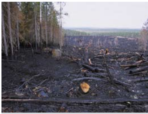
Нередко деревья за пределами лесосеки повреждаются огнем при «огневой очистке» (сжигании порубочных остатков).

Если вблизи границы отведенной лесосеки (не далее 50 м) имеются свежие пни или повреждения на корневых лапах и стволах живых деревьев, это является нарушением, за которое лесозаготовитель должен нести ответственность. Однако, необходимо проверить — являются ли пни и другие повреждения за границей лесосеки свежими (т. е. совпадают ли эти повреждения по времени с про-