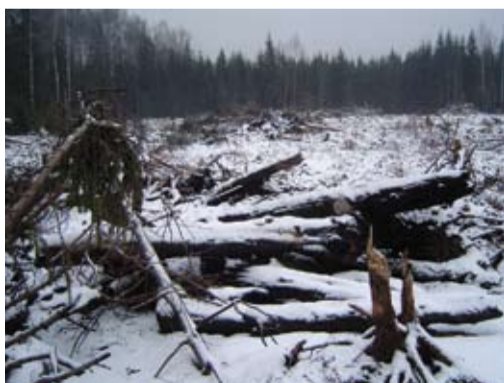
На многих особо охраняемых природных территориях коммерческая заготовка древесины происходит под видом «сплошных санитарных рубок».

Большой проблемой является то, что многие региональные особо охраняемые природные территории создавались еще во времена СССР, когда рубки ухода проводились именно как рубки ухода, а не как средство заготовки коммерческой древесины; рубок ухода, при которых вырубается весь древостой (сплошных), в то время не существовало вовсе. Поэтому режимами многих старых ООПТ разрешаются рубки ухода. В современных условиях, когда рубки ухода чаще всего имеют характер коммерческих рубок и могут быть сплошными, их проведение противоречит исходному смыслу существования этих особо охраняемых природных территорий. Даже если они не являются нарушениями с формальной точки зрения, они могут противоречить основной цели управления лесами особо охраняемых природных территорий — сохранению лесной природы.