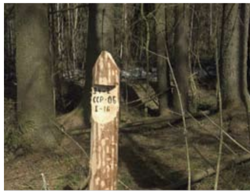
При правильном отводе лесосеки все ее углы должны быть обозначены специальными столбиками, а границы — вешками, ленточками или иными знаками.

Стоит проверить наличие признаков отвода по всему периметру лесосеки. Очень часто бывает