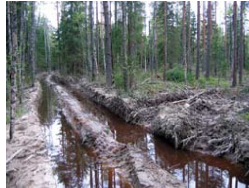
Обычным нарушением при рубках является сверхнормативное повреждение почвы.

Нарушение почвенного покрова на лесосеках является одной из причин, способствующих развитию почвенной эрозии, ведущей к потере плодородия почвы и к загрязнению водоемов взвешенными частицами. Кроме того, нарушение почвенного покрова (в первую очередь — уплотнение) может вести к заметной задержке лесовосстановления. В отдельных случаях на некоторых типах почв волока и погрузочные площадки могут уплотняться на