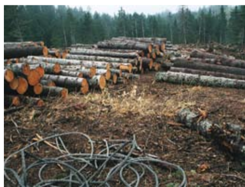
В летний период года хранение в лесу неокоренной древесины запрещается, так как может привести к массовому размножению опасных насекомых.

Кроме того, длительно хранящаяся или брошенная на лесосеках древесина представляет собой свидетельство расточительного отношения к лесу — поскольку уже после нескольких недель хранения в летний период такая древесина теряет свою товарную ценность, т. е. лес оказывается вырубленным без всякого хозяйственного смысла. А бессмысленные рубки и расточительное отноше-