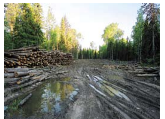
Это не сплошная рубка, как может показаться на первый взгляд, а всего лишь технологический участок (погрузочная площадка) рубки ухода.

Если лесосека отведена должным образом и имеет ясные границы, то долю волоков следует опреде-