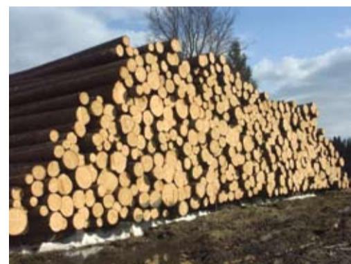
Если штабель древесины, вывезенной со сплошной санитарной рубки, более чем наполовину состоит из древесины без малейших признаков повреждения — обоснованность такой рубки вызывает сомнения.

Сплошную санитарную рубку при правильно проведенном отводе можно узнать по обозначению на столбике. Если на участке, обозначенном как сплошная санитарная рубка, видны следы руб-