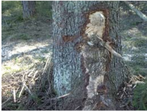
Количество оставленных после выборочной рубки деревьев с такими повреждениями не должно превышать 3%.

мертвый участок поверхности ствола, который служит местом легкого проникновения различных инфекций в организм дерева; такие участки могут постепенно зарастать с краев, но если обдир крупный, то его зарастание может растягиваться на десятки лет);