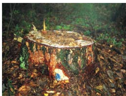
Так может выглядеть клеймо на корневой лапе при выборочной санитарной рубке.

На практике очень часто выборочные санитарные рубки проводятся без клеймения. Соответственно, если рубка проводится как санитарная (об этом можно судить на основании надписей на рубочных столбиках, если таковые имеются), но на пнях срубленных деревьев отсутствуют клей-