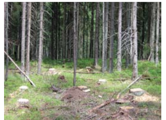
Как правило, самые крупные деревья являются самыми здоровыми и быстрорастущими, и если их при «рубке ухода» удаляют в первую очередь, это ведет к ослаблению леса.

Выборка преимущественно самых крупных и здоровых деревьев ведет к тому, что в лесу остаются главным образом слабые и больные, в мас-